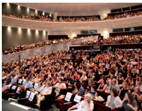
© L'Action Sociale - Assises 2018

Selon vos possibilités : venez à Nantes pour plus de rencontres et de convivialité ou suivez les Assises sur notre plateforme dédiée (application imagina) avec des live de qualité et de l'interactivité.